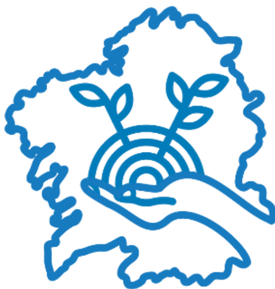
Imaxe 28. Acceso a páxina do Banco de Terras

Premendo na imaxe inferior, poderemos acceder a páxina web do Banco de Terras.