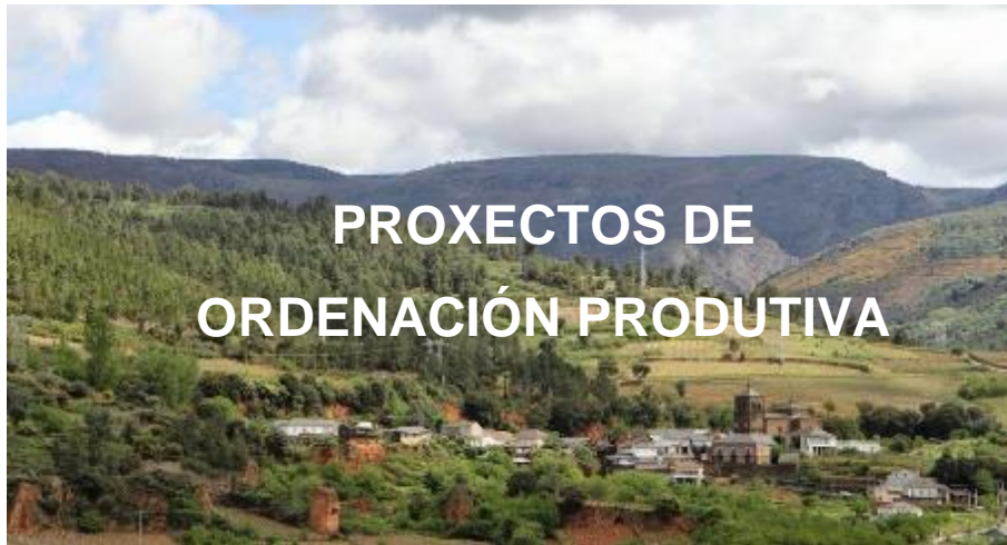
Imaxe 7. Acceso ós diferentes Proxectos de Ordenación Produtiva