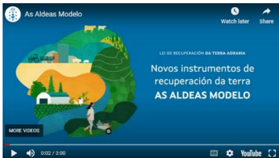
Imaxe 4. Vídeo informativos das Aldeas Modelo.

Os links das ferramentas, accedese premendo as seguintes imaxes.