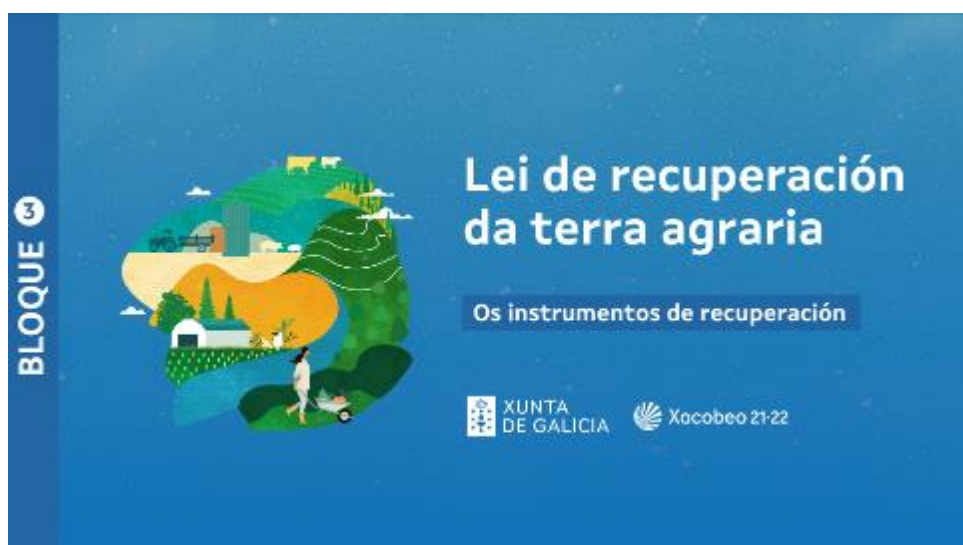
Imaxe 5. Presentación informativa sobre Aldeas Modelo.