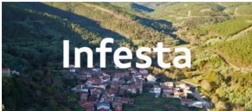
Imaxe 3. Vista de paxaro da aldea modelo de Infesta

Premendo no imaxe inferior, pódese acceder a Guía de Ordenación Produtiva de Infesta.