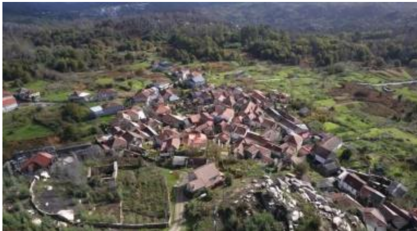
Imaxe 2. Vista xeral da Aldea Modelo de Muimenta

Premendo no imaxe inferior, pódese acceder a Guía de Ordenación Produtiva de Muimenta.