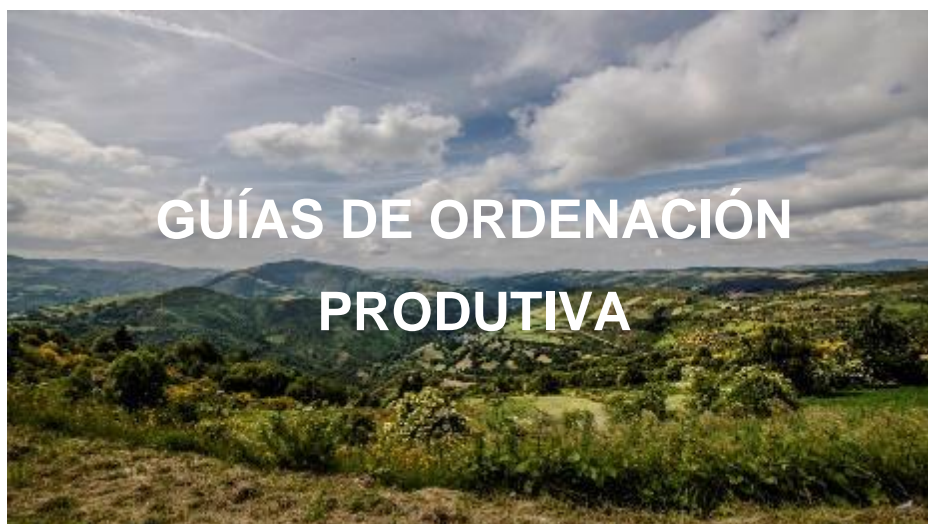
Imaxe 6. Acceso ás diferentes Guías de Ordenación Productiva

Premendo sobre a imaxe inferior, accedese ás Guías de Ordenación Productivas actualmente rematadas.