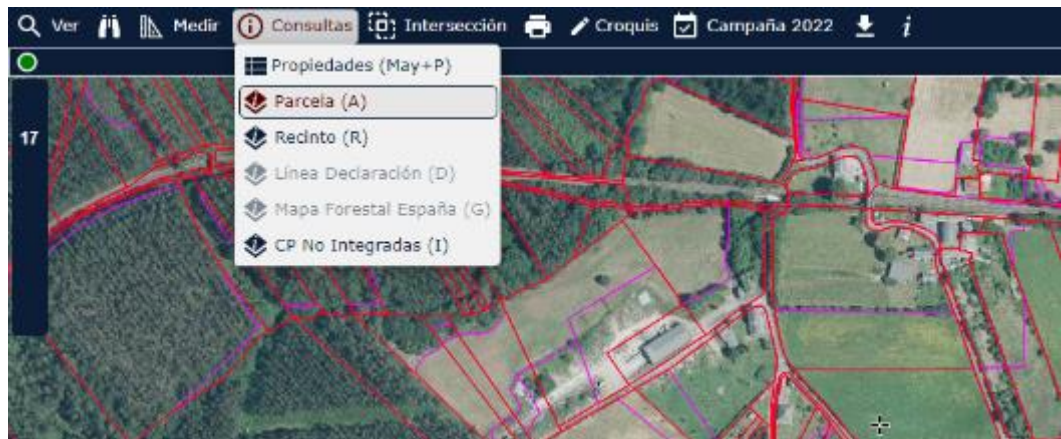
Imaxe 20. Consulta dunha parcela mediante a páxina do SIXPAC