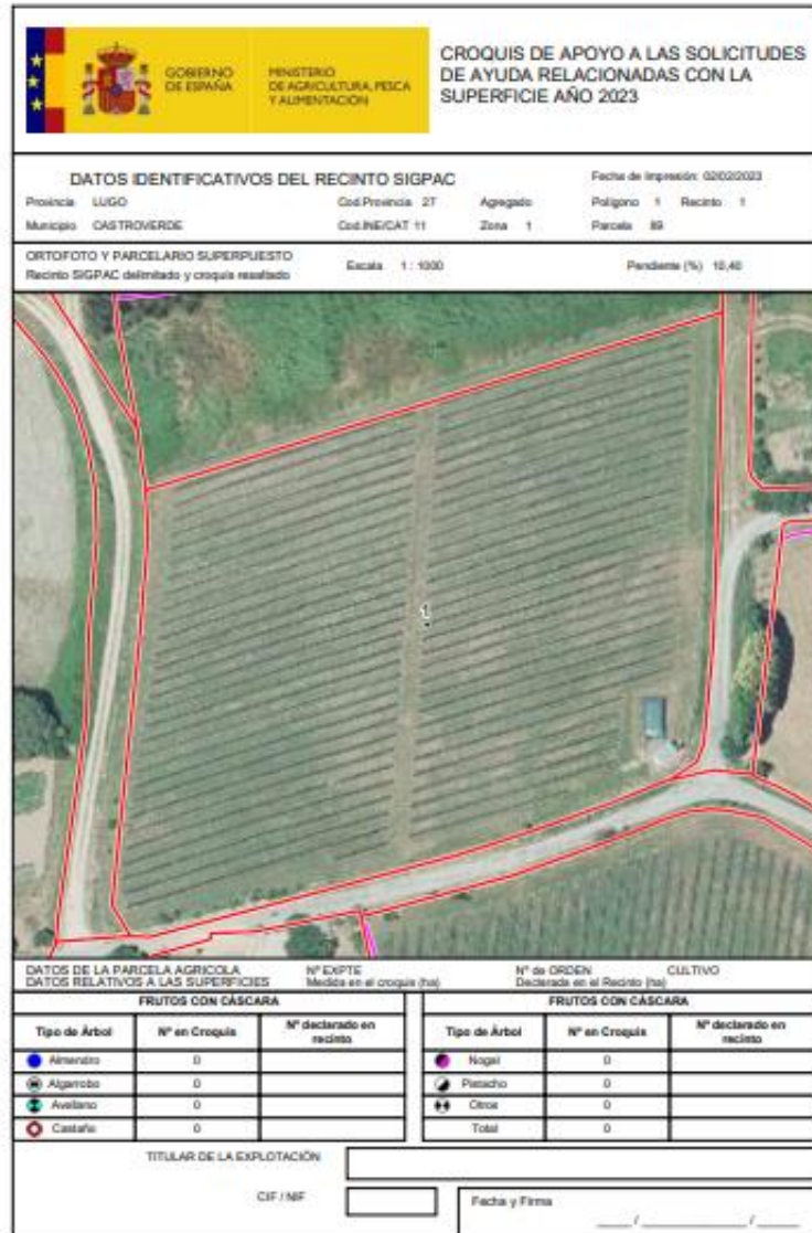
Imaxe 18. Croques e información dunha parcela en "pdf"